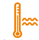
Production d'eau chaude